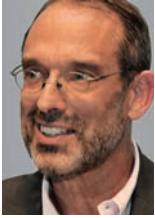
Heinz Fassmann Vize rektor