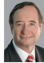
Christoph Leitl Präsident der Wirtschaftskammer Österreich