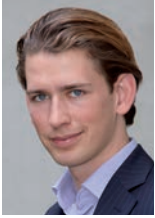
Sebastian Kurz Staatssekretär für Integration